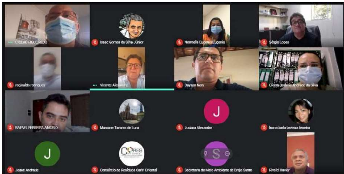
FOTO DE FREQUÊNCIA

CONSÓRCIO PÚBLICO DE MANEJO DOS RESÍDUOS SÓLIDOS DA REGIÃO CARIRI ORIENTAL