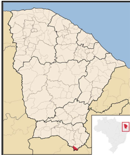
Figura 08 – Mapa de Localização do Município de Penaforte/CE

O município de Penaforte está localizado na região sul do Estado do Ceará, a aproximadamente 545 km da capital, Fortaleza, tendo como limites territoriais os municípios de Jardim e Jati, além de fazer divisa com o Estado de Pernambuco.