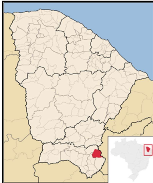
Figura 03 – Mapa de Localização do Município de Barro/CE

O município de Barro está localizado na região sul do Estado do Ceará, a aproximadamente 524 km da capital, Fortaleza, tendo como limites territoriais os municípios de Aurora, Mauriti e Milagres, além de fazer divisa, a leste, com o Estado da Paraíba.