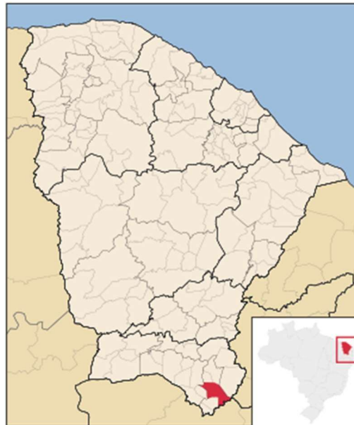
Figura 04 – Mapa de Localização do Município de Brejo Santo/CE

O município de Brejo Santo está localizado na região sul do Estado do Ceará, a aproximadamente 498,3 km da capital, Fortaleza, tendo como limites territoriais os municípios de Missão Velha, Abaiara, Milagres, Mauriti, Porteiras e Jati, além de fazer divisa, ao sul, com o Estado de Pernambuco.