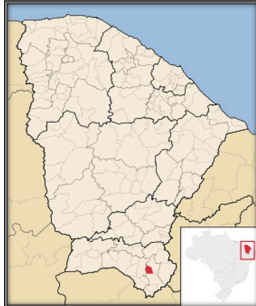
Figura 01 – Mapa de Localização do Município de Abaiara/CE

O município de Abaiara está localizado na região sul do Estado do Ceará, a aproximadamente 523 km da capital, Fortaleza, tendo como municípios limítrofes Milagres, Brejo Santo e Missão Velha.