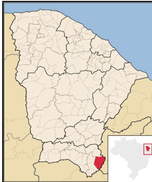
Figura 06 – Mapa de Localização do Município de Mauriti/CE

O município de Mauriti está localizado na região sul do Estado do Ceará, a aproximadamente 491 km da capital, Fortaleza, tendo como limites territoriais os municípios de Barro, Milagres e Brejo Santo, além de fazer divisa com os Estados da Paraíba e Pernambuco.