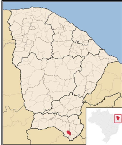
Figura 09 – Mapa de Localização do Município de Porteiras/CE

O município de Porteiras está localizado na região sul do Estado do Ceará, a aproximadamente 530 km da capital, Fortaleza, tendo como limites territoriais os municípios de Brejo Santo, Jardim, Missão Velha e Jati.