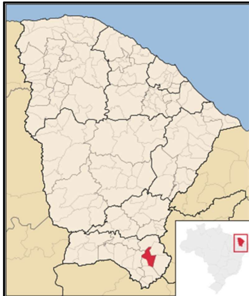
Figura 07 – Mapa de Localização do Município de Milagres/CE

O município de Milagres está localizado na região sul do Estado do Ceará, a aproximadamente 475 km da capital, Fortaleza, tendo como limites territoriais os municípios de Aurora, Barro, Mauriti, Brejo Santo, Abaiara e Missão Velha.